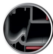
Innowacyjna środkowa uszczelka