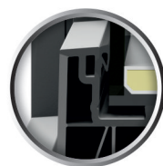
Niska wysokość złożenia - 110 mm