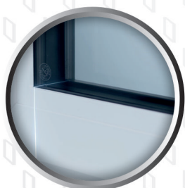
Proste kontury listew 90°