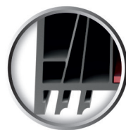
6 komór w ramie