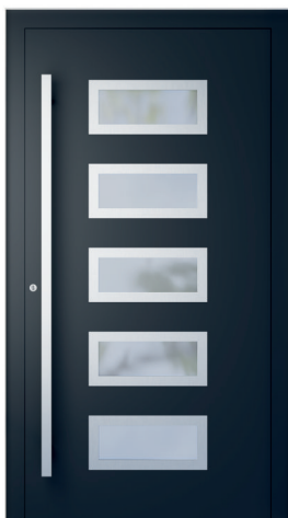
ME 011NX str. 2.21