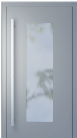
ME 008 str. 2.19