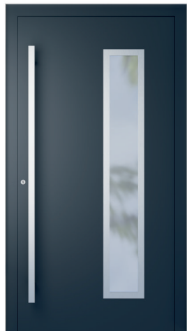
ME 004NX str. 2.20