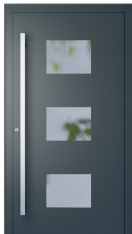
ME 021 str. 2.19