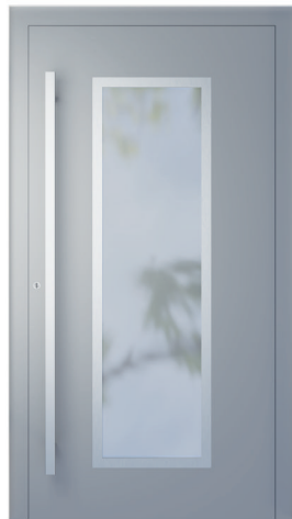
ME 008NX str. 2.21