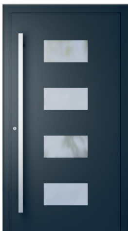
ME 211 str. 2.20