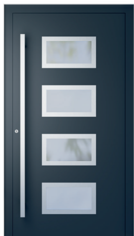
ME 211NX str. 2.21