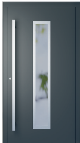
ME 001NX str. 2.20