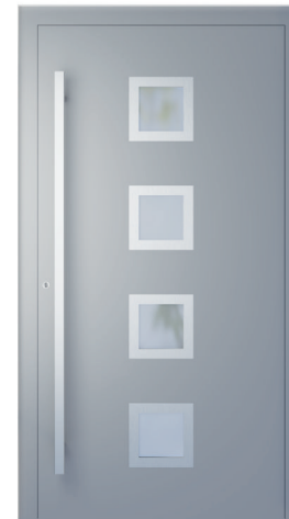
ME 003NX str. 2.20