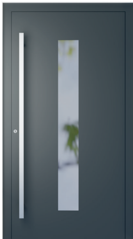
ME 001 str. 2.18