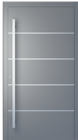
ME 002 str. 2.18