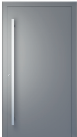
ME 000 str. 2.18