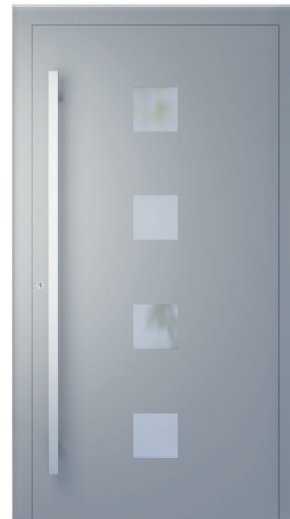
ME 003 str. 2.18