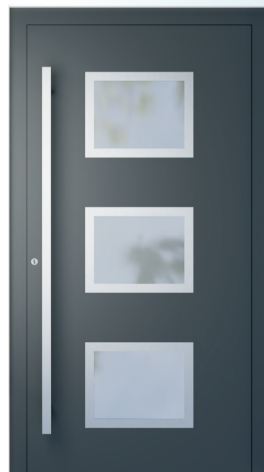
ME 021NX str. 2.21