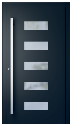
ME 011 str. 2.19