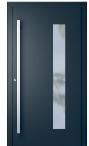
ME 004 str. 2.19